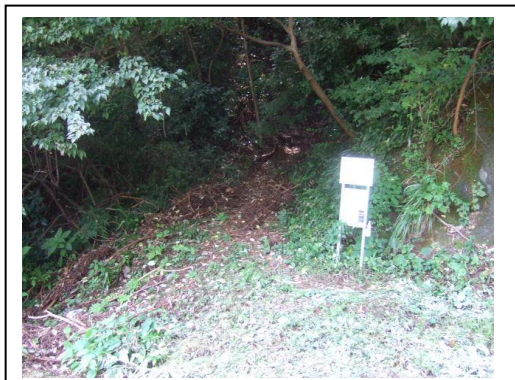
高取山ハイキングコース入口