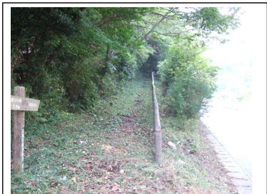
仏果山ハイキングコース入口